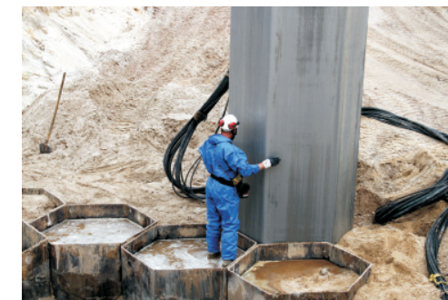
▲ Ausrichten des Hexagonalrohres