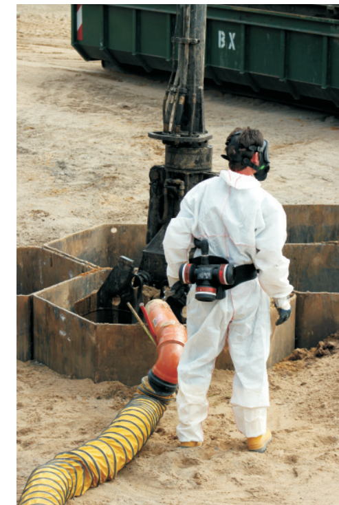
▲ Persönlicher Arbeitsschutz

Auf Flächen mit geringerer Aushubtiefe und fehlenden Gerölllagen sowie einem größeren Sicherheitsabstand zur Nachbarbebauung fiel die Entscheidung zugunsten eines Bodenaustausches im Wabenverfahren. Der Einsatz des Verfahrens brachte dem Bauherrn den Vorteil eines wirtschaftlicheren Einheitspreises je Sanierungskubatur, erhöhte den Leistungsfortschritt, ersparte den bei Großlochbohrverfahren systembedingten Überschnitt und senkte damit die Transport-, Entsorgungs- und Einbaukosten (Füllboden). Im Gegensatz zu den Großlochbohrungen, bei denen beim Rückfüllprozess nur eine lockere Lagerungsdichte erzielt wird, kommt es beim Einbringen und Ziehen der Wabenprofile automatisch zu einer Nachverdichtung. Ergebnisse der Fremdüberwachung bestätigten eine mitteldichte Lagerungsdichte ohne gesonderte Tiefenverdichtung. Im Bereich der Großlochbohrungen erzielte eine spezielle Rüttelbohle die entsprechende Nachverdichtung. Durch den gleichzeitigen Einsatz von bis zu zwei Drehbohranlagen bzw. einer Drehbohranlage in Kombination mit der Wabentechnik konnte der Bodenaustausch auch bei den gegebenen engen Baugrubenverhältnissen im geplanten Zeitrahmen vollständig realisiert werden.