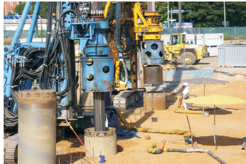
▲ Einbringen der Außenverrohrung (Gerät vorn) und Aushubvorgang (hinten)