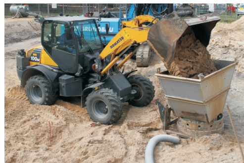
▲ Rückverfüllung in Großlochbohrung