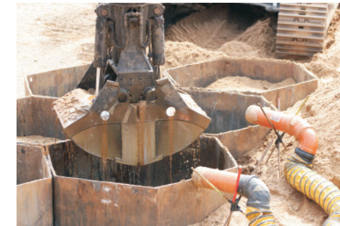
▲ Wabenaushub mit Absaugung

Die besondere Spezifik dieses Projektes machte die Umsetzung eines vom Bauherrn angenommenen Nebenangebotes aus, welches aus einer Kombination der bewährten Verfahren durch "Großlochbohrung" und "Hexagonalrohraustausch" bestand. Hier wurden die ausgeschriebenen Bohrungen auf den Bereich beschränkt, in dem die Sanierungstiefe bis 10 m unter Gelände reichte (Stauer) und zudem mit Geröllen zu rechnen war. Wegen der direkt angrenzenden Nachbarbebauung waren hier die erschütterungsarmen Großlochbohrungen sehr gut geeignet.