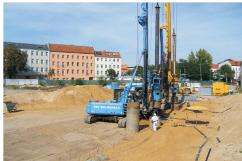
▲ Paralleler Einsatz von Großlochbohrgeräten

Vor dem Einsatz der Spezialtiefbauverfahren war in einer ersten Phase die komplette Beseitigung