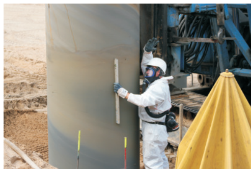
▲ Ausrichtung der Verrohrung