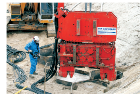
▲ Ansetzen des Rüttlers an die Wabe